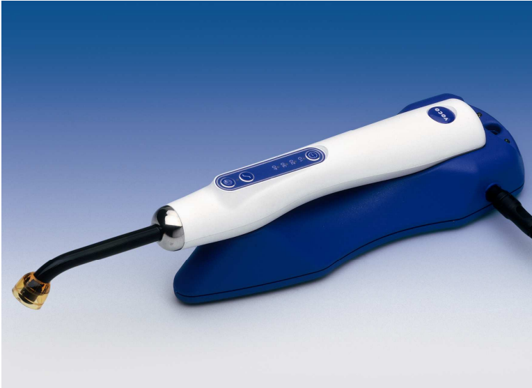
Lâmpada LED de Alta Potência