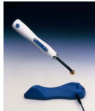
Base carregador com medidor de intensidade de luz integrado